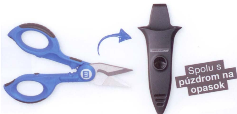
Káblové nožnice No.35

LSA Sensor No.40 - osádzanie káblov bez spájkovania, skrutkovania a bez osizolovania. Súčasne aj strihanie káblových vodičov na pásoch LSA. S výklopným vyťahovacím háčikom a uvoľňovacou čepeľou; so snímačom koncovej polohy vodiča.