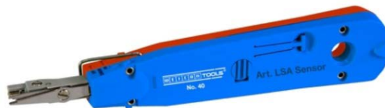
LSA Sensor No.40