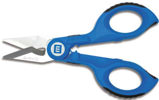
Káblové nožnice No.35